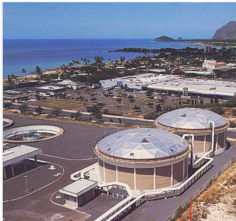
アルミドームルーフ適用例（水処理設備のタンク屋根）